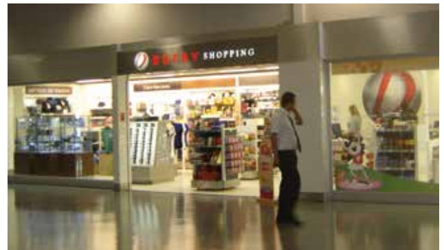
Dufry poursuit son développement au Brésil.

Pour augmenter l'efficacité opérationnelle de l'entrepôt et amener une plus grande agilité dans la disponibilité des produits au point de vente, le nouveau système d'entrepôt a été mis en œuvre en août 2012. Ce projet, géré par Roberto Baence, a débuté en 2011. Comme Tiago Gloria l'indique depuis le Brésil, les résultats sont très positifs : « L'entrepôt fonctionne de façon beaucoup plus mûre, atteignant des taux de remplissage de 99,5% dans les boutiques d'AJRJ. C'est un bon taux si l'on considère l'arrivée de la mise en œuvre de ce système il y a juste 10 mois et une performance proche des 90%, mais avec de bonnes perspectives pour l'amélioration à court terme ». ■