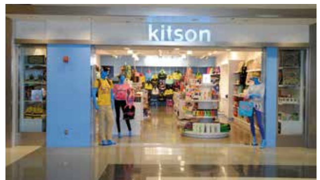
Nouvelle boutique Kitson dans le Terminal 7 à LAX.

Le détaillant branché Kitson, sur le très tendance Robertson Boulevard (ainsi que plusieurs autres emplacements dans et autour de Los Angeles), est devenu l'étape préférée de nombreuses célébrités à Hollywood.