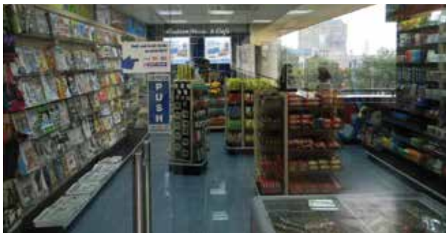
Boutique Hudson en Inde